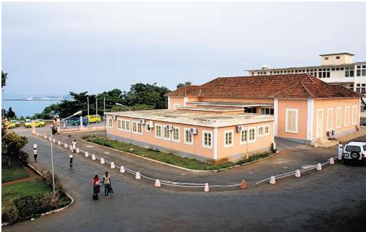
Erst gerade saniert und umgebaut: Die Notaufnahme des Spitals Sao Tomé kann sich mittlerweile sehen lassen.